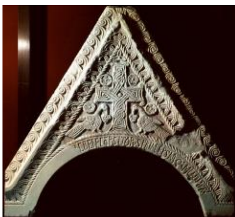
Immagine 1: timpano di Uzdojce presso Knin

6. Osserva le immagini dei frammenti di pietra e rispondi alle seguenti domande.