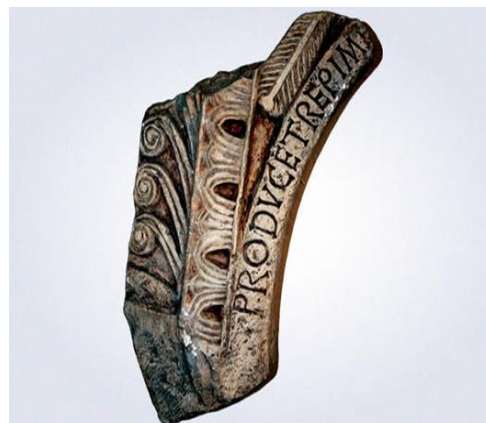
Immagine 2: frammento da Rižinice